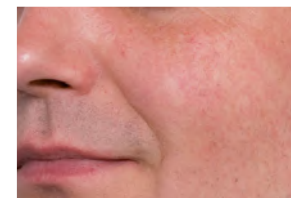
Erweiterte Äderchen vor und nach 3 Behandlungen.