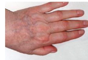
Altersflecken vor und nach 1 Behandlung.