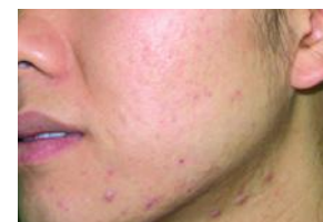
Akne vor und nach 1 Behandlung.